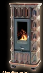
Afrodita mini kapliczka/brązowa