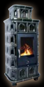
Olymp kapliczka / zielony