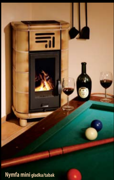
Nymfa mini gładka/tabak

Ogrzewanie promiennikowe – zamknięta przysłona – zwiększa się temperatura pieca, który wytwarza promieniowanie podczerwone i przesyła energię ścianom, przedmiotom, osobom.... Przy podobnym komforcie cieplnym temperatura pomieszczenia może być niższa (wyższa wilgotność powietrza) i równomierniej rozłożona. Ciepło z promieniowania jest naturalne (słońce), bardzo przyjemne, nastrojowe i przypomina prawdziwe „domowe ognisko”. Połączenie tych całkiem różnych rodzajów ogrzewania w jednym produkcie daje piecom ENBRA szczególną wartość użytkową.