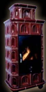
Olymp kapliczka / bordo