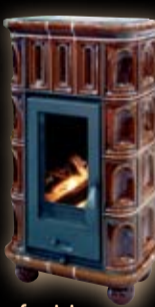
Nymfa mini kapliczka/brązowa