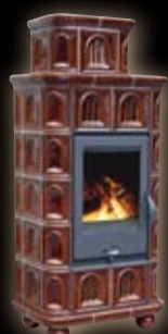
Olymp kapliczka / brązowa