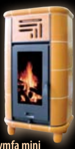
Nymfa mini gładka /cotto