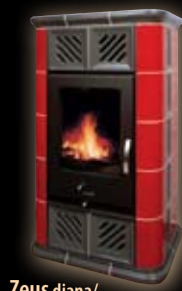
Zeus diana/ nierdzewny + picasso