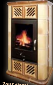
Zeus diana/ mima tabak