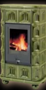
Afrodita kapliczka / zielona