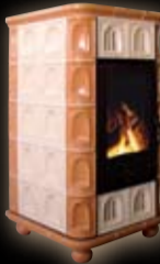
Herkules kapliczka/ jasny+ciemny holand