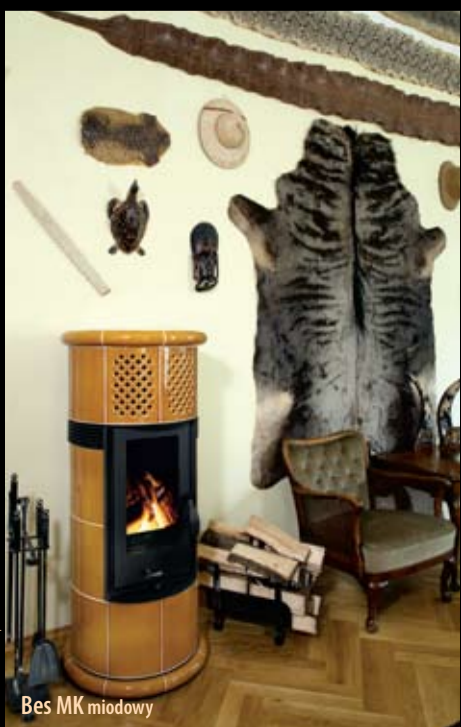
Bes MK miodowy

Tradycja z 1922 roku połączona z najnowszą wiedzą technologiczną, pozwoliła stworzyć piece z doskonałym systemem regulacji dopływu powietrza, opływu szyby i odprowadzenia ciepła. Piece ENBRA osiągają sprawność 80% - jedną z najwyższych na rynku. W porównaniu ze zwykłymi piecami osiągają oszczędność paliwa o ponad 30%. Przy średnim poziomie użytkowania oznacza to zwrot ceny pieca w ciągu 5 lat.