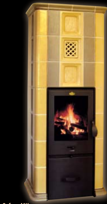
Orfeus MK żółta + szara

Wyróżnienia naszej techniki i technologii: „Złoty medal” na targach SHK Brno 2006 „Złota plakietka” na targach Coneco 2006 Bratislava „Wyróżnienie” na targach Aquatherm 2005 Praha „Wyróżnienie” na targach Aquatherm 2002 Praha