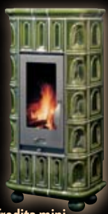
Afrodita mini kapliczka/zielona