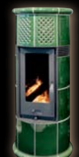
Bes MK zielony