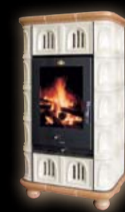
Afrodita kapliczka / jasny+ciemny holand