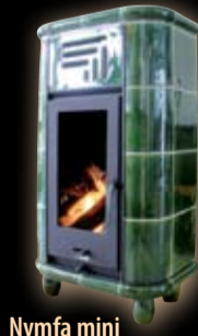
Nymfa mini gładka /zielona