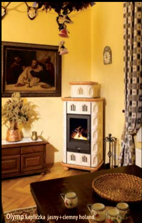
Olymp kapliczka jasny+ciemny holand