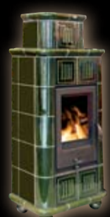
Olymp diana / zielony