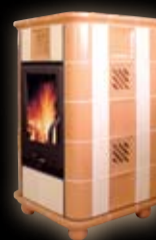
Herkules diana/mima jasny+ciemny holand